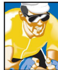
FUNDACIÓN MIGUEL INDURAIN FUNDACIÓN