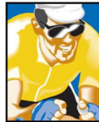
FUNDACIÓN MIGUEL INDURAIN FUNDACIÓN