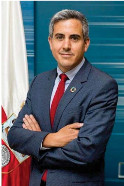
D. Pablo Zuloaga Martínez Vicepresidente del Gobierno de Cantabria

Arranca esta nueva edición del Campeonato de España de Ciclocross en Torrelavega que este 2021 alcanza una trascendencia mayor que la de años anteriores. Además de ser una de las citas del panorama nacional que más expectación y seguimiento genera entre los aficionados, este año representa la vuelta del ciclismo con mayúsculas y con una disciplina que tiene entre sus grandezas precisamente la superación de obstáculos en el camino.