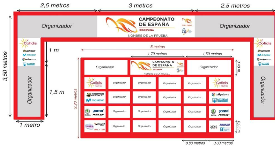
IMAGEN DE LA ZONA DE META. Respetando el espacio reservado para la RFEC que se indica en la siguiente imagen.