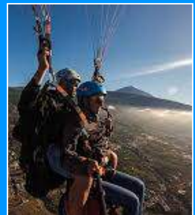
Calles de La Laguna