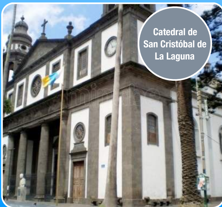
Catedral de San Cristóbal de La Laguna

Además de cultura, San Cristóbal de la Laguna es un lugar ideal para los amantes del senderismo, gracias a su entorno paisajístico, con parques naturales y montes cubiertos por la flora endémica de Canarias. No se olvide de contemplar las panorámicas espectaculares de las islas desde algunos de los miradores de la zona, como el de las Mercedes o el de la Cruz del Carmen. Disfrute de unas vacaciones inolvidables en un lugar irrepetible.