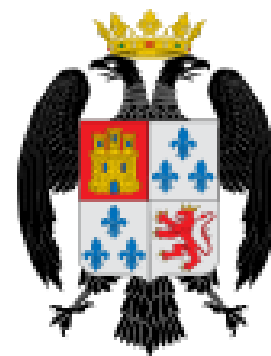
Escudo de Montalbán