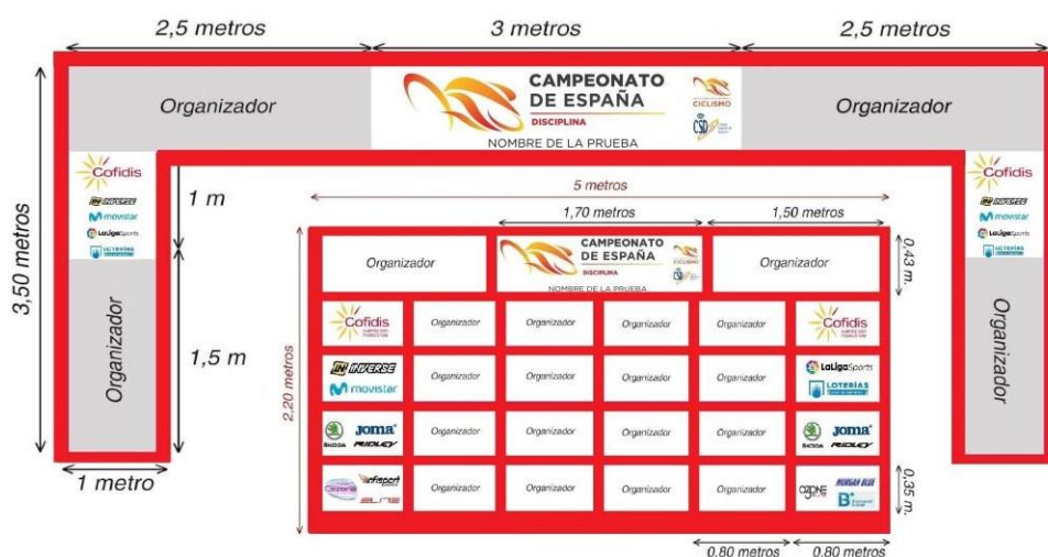
IMAGEN DE LA ZONA DE META. Respetando el espacio reservado para la RFEC que se muestra en la siguiente imagen.

IMAGEN DEL PODIO Y PUENTE DE META. Crear la lona de podio y puente de meta con el diseño y medidas aproximadas de la siguiente imagen. El Organizador deberá enviar el diseño a la RFEC para su aprobación.